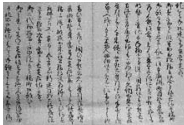
資料 の 2