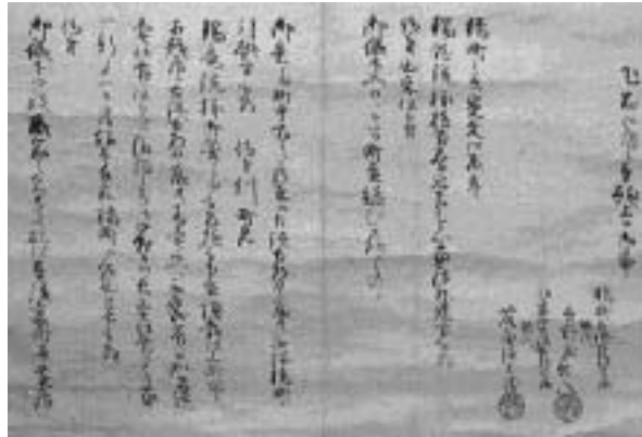
資料 の 1