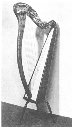
図1 アイリッシュハープ 1)

アイリッシュハープは、時を経て共鳴胴の増大により音量が増し、弦の増加で表現力が広がった。世界各地でつくられており、日本製は鉤部の構造改良・改善にて転調がスムーズにできるのが特徴で評価が高い。