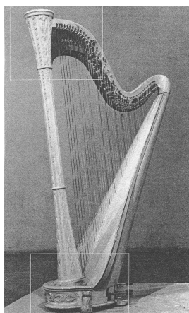
図2 ペダルハープ 2)