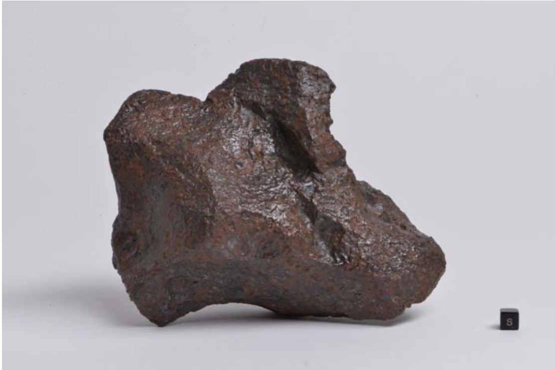
国内で発見された鉄隕石のリスト（国立科学博物館のデータによる）

長良隕石の外観写真。画面右下の黒いキューブが1センチ角。