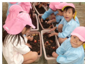
チューリップの球根植え