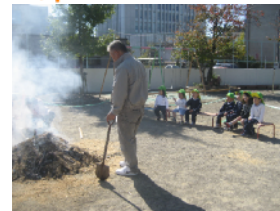
園庭で焼き芋パーティ