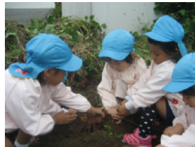
幼稚園の畑で芋掘り体験