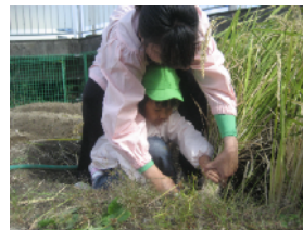
かまを使って稲刈り体験