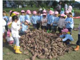
農園でいっぱい掘ったよ