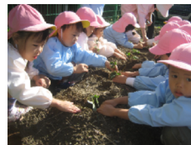
イチゴの苗を植えたよ