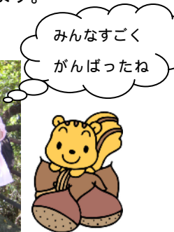
いろんな運動遊びを友達や先生と楽しんでいます