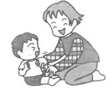
足先から体の上のほうに向かって、子どもをくすぐる。