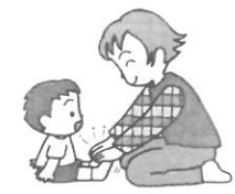
子どもの足先を軽くたたく。