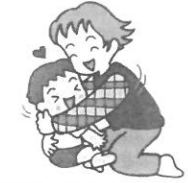
子どもの体じゅうを大きくくすぐり、最後に「ギューツ」と抱きしめる。