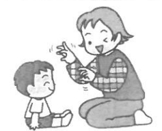
大人は子どもの前で、指をもじよもじよ動かす。