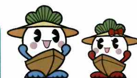
笠松町 かさまるくん かさまるちゃん